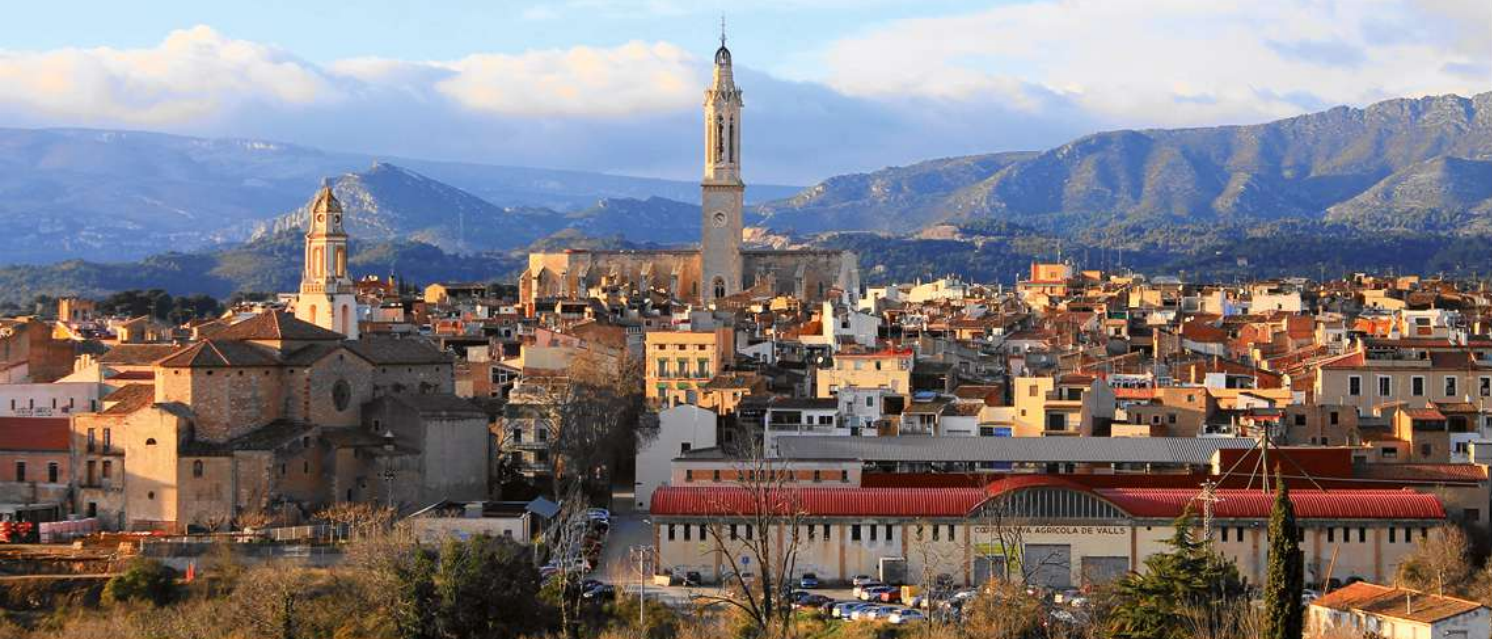
Esperanza Villos Goya

Valls és la capital de l'Alt Camp i de l'interior del Camp de Tarragona. Per l'Alt Camp hi passen dos rius, el Francolí i el Gaià i els seus afluents, és una comarca amb una gran diversitat de paisatges, des de la vall fins a la muntanya, passant pels conreus d'avellanes, cereals, vinyes, ametlles, garrofes, olives... Valls també està situada dins de la marca turística Costa Daurada, una de les zones turístiques més prestigioses d'Europa. Anualment rep milions de visitants estrangers i és una de les zones de platja preferida pels habitants de l'Estat espanyol.