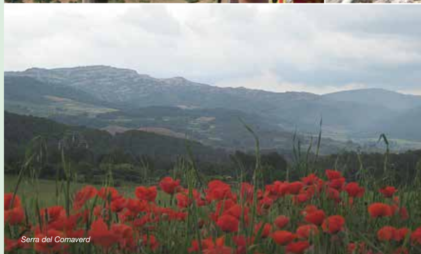
Serra del Comavert