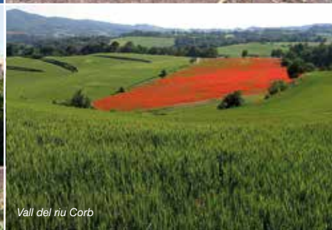
Vall del riu Corb