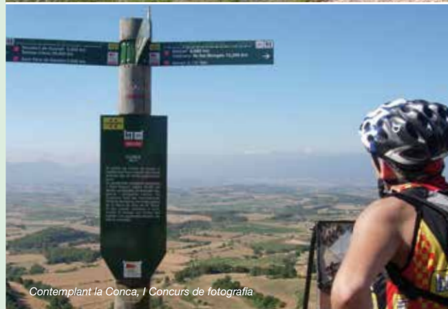
Contemplant la Conca, l'Concurs de fotografia