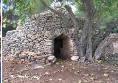
Barraca de l'Auget