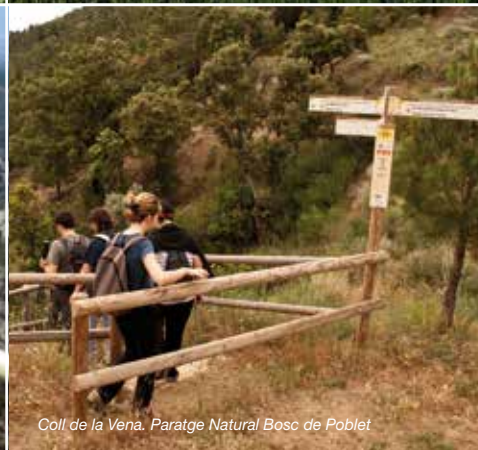
Coll de la Vena. Paratge Natural Bosc de Poblet