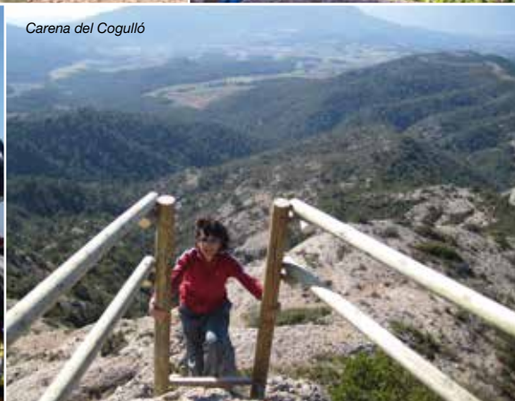
Carena del Cogulló