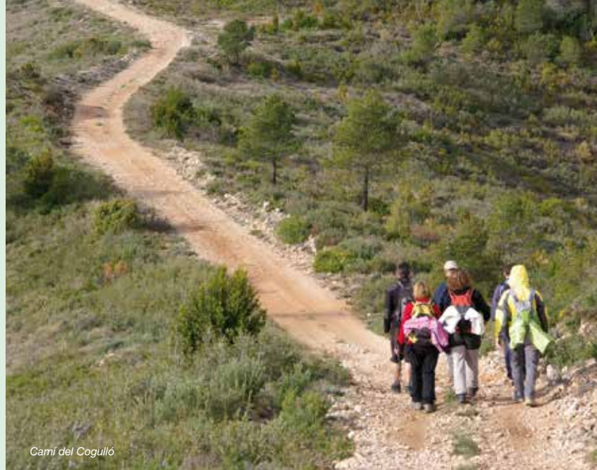
Camí del Cogulló

I és que el GR 175 La Ruta del Cister és molt més que un sender: és el vincle d'unió entre els tres monestirs del cister més rellevants de Catalunya, el fil conductor per la història dels seus pobles, l'aproximació a unes terres modelades per l'home en alguns indrets i a una natura salvatge en d'altres, el tast d'una gastronomia autèntica arrelada a la terra i el contacte amb la gent que hi viu i que estima aquests paisatges. És tot allò que esteu disposats a trobar-hi. És el GR 175 La Ruta del Cister .