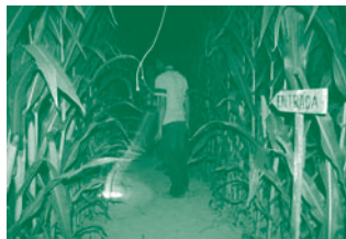
Laberint de blat de moro