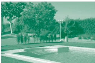
Allotjaments Cal Tonet / El Colomar

El laberint es troba dins de Masia Esperança, una finca agrícola al poble de Castellserà (Urgell - Lleida). A més la finca ofereix la possibilitat de fer-hi estada en allotjaments rurals amb piscina: Cal Tonet: de 4 a 7 places El Colomar: de 2 a 5 places