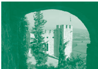
Castell de Montsonís